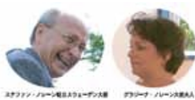
スウェーデン大使夫妻とノレーン大使夫人

ふだん職場、学校、家庭では会えない人たちと、ゆるいフリーな対話を楽しみましょう。